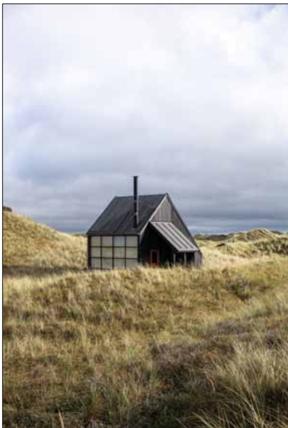
Klaus Rifbjergs skrivehytte tegnet af Alfred Hansen.

Foredraget afholdes i anledning af "Folkeuniversiteternes dag. Sammen bliver vi klogere".