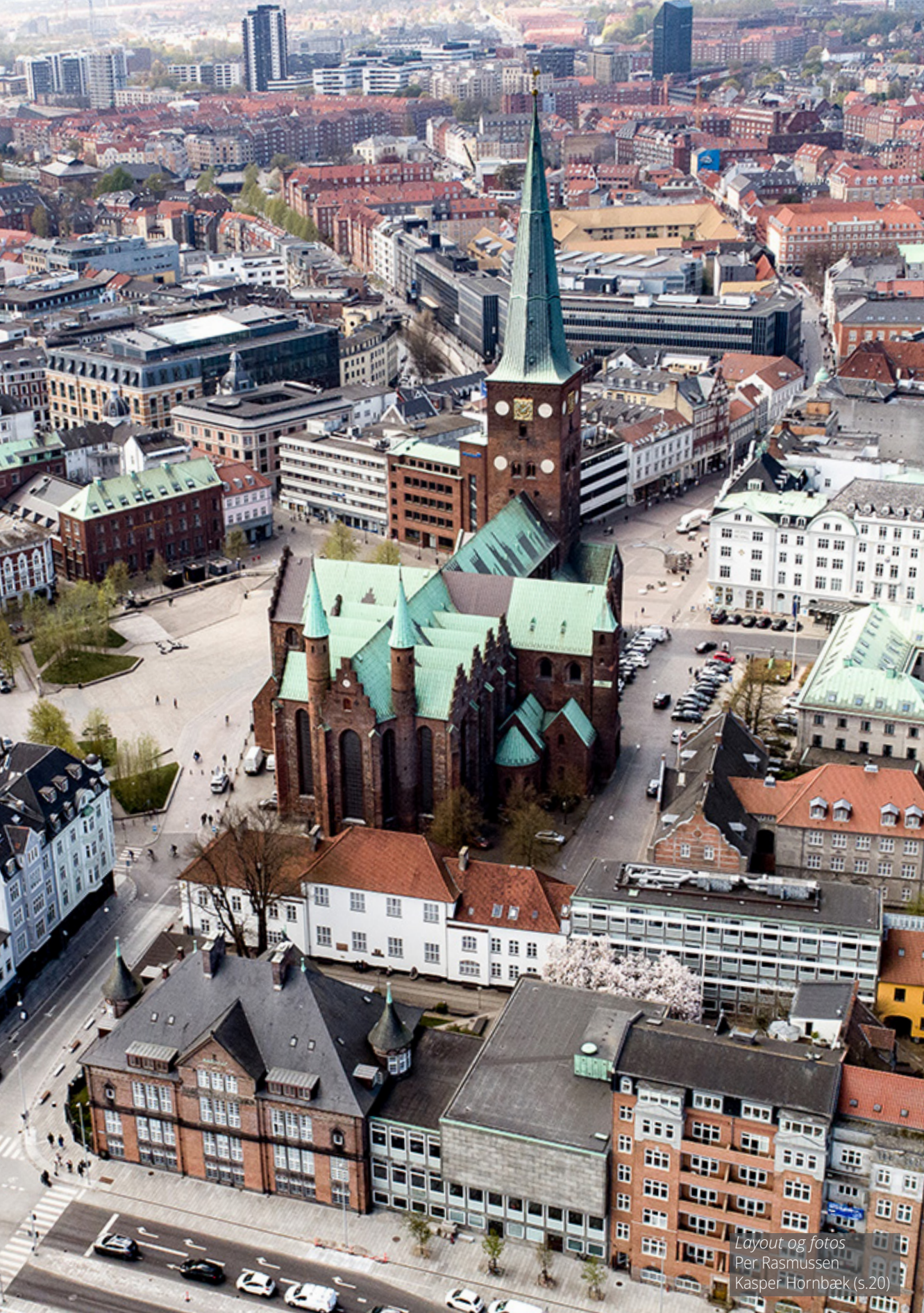
Layout og fotos Per Rasmussen Kasper Hornbæk (s.20)