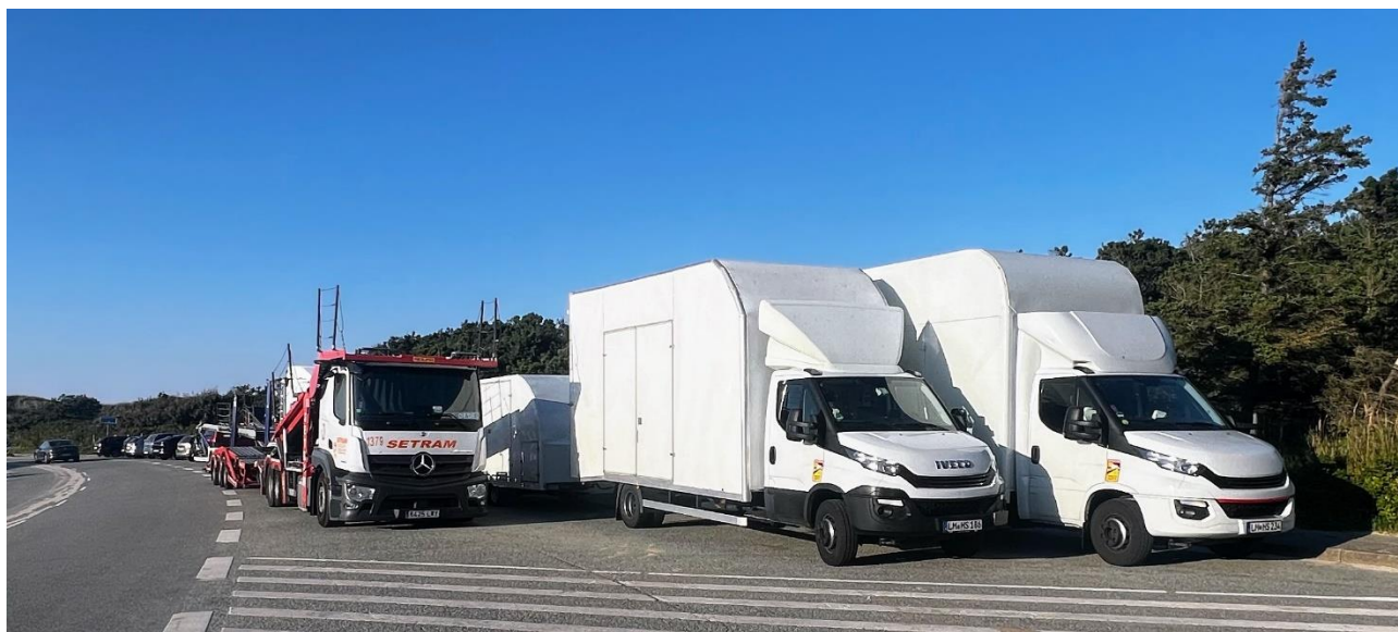
Parkering i forbindelse med arrangementet Tannistesten for kåringen af "Årets Bil".

Endelig vil vi godt pege på problematikken omkring parkering ved ankomsten til p-pladsen ved Tversted Strand nord for Hotel Tannishus. Som nedenstående billede viser er parkeringen ret så kaotisk pt. pga. arrangementet med kåring af "Årets Bil". Vi tror ikke på projektets løsning med båse til en mere "ordnet" parkering. Det vil ikke fungere i forbindelse med det aktuelle arrangement (hvilket billedet tydeligt viser) og vi tror heller ikke det vil fungere i andre sammenhænge. Lad det forblive som det er i dag. Alle finder tydeligvis fint ud af at parkere fornuftigt. Ved en vestlig placering af promenaden blandes de gående ikke med de parkerede biler.